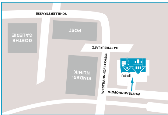
So finden Sie uns