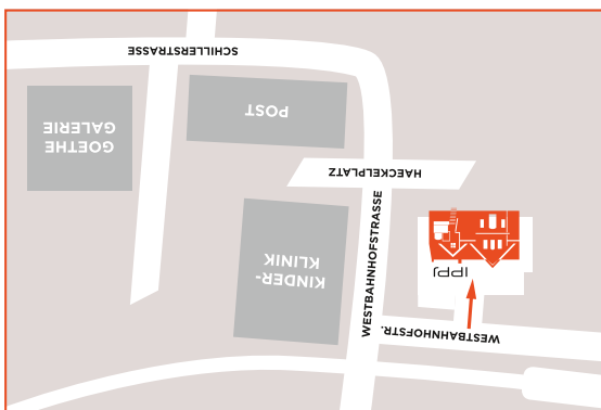
So finden Sie uns